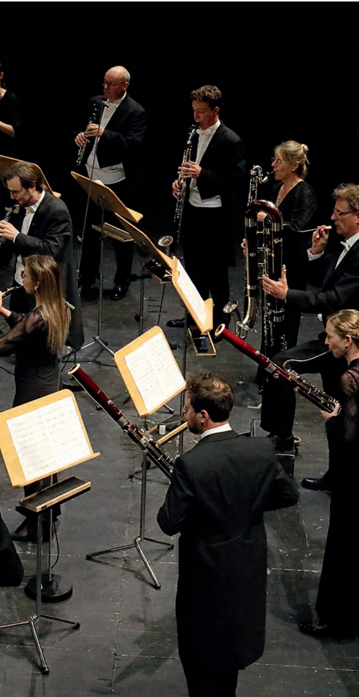
Vladimir Jurowski und das Bayerische Staatsorchester